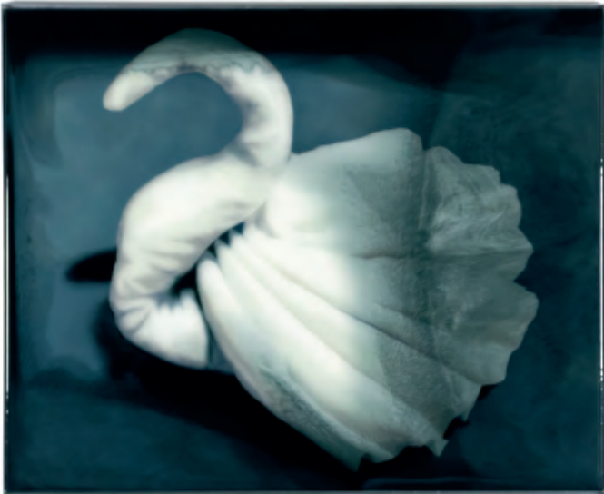
Sarah De Vos Romance is a ticket to paradise, 2020